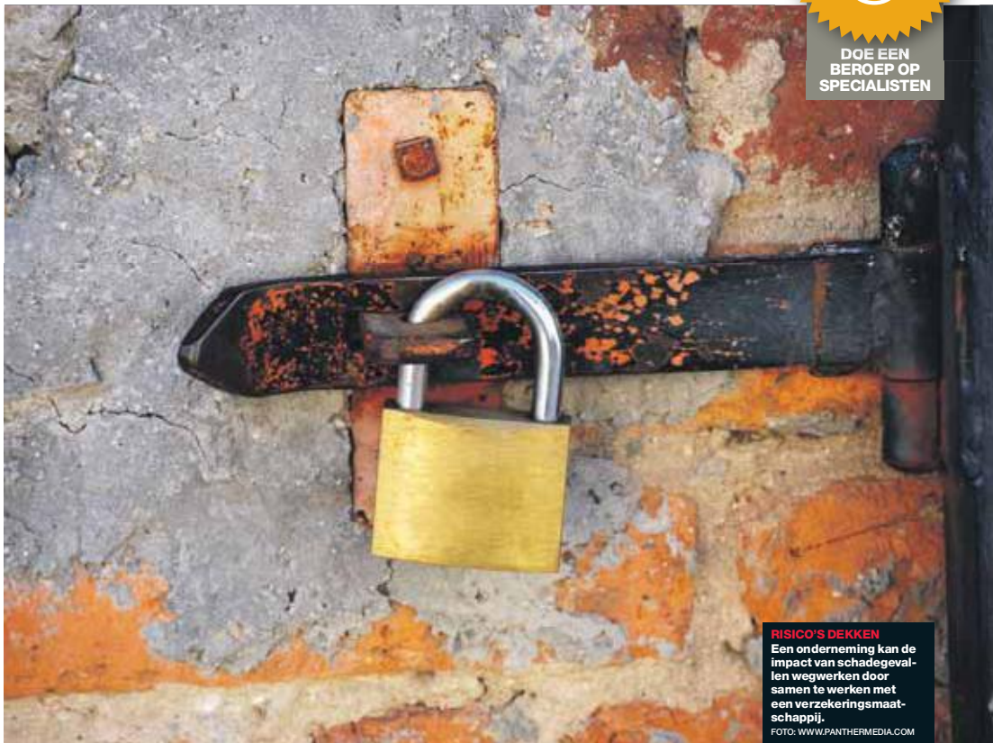
RISICO'S DEKKEN Een onderneming kan de impact van schadegevallen wegwerken door samen te werken met een verzekeringsmaatschappij.